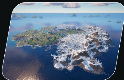
Fortnite Battle Royale

Les mondes de LEGO® Fortnite sont 19 fois plus grands que l'île de Fortnite Battle Royale !